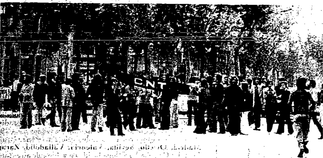
La fotografía de Soteras nos muestra un momento de la manifestación que cuajó en el Paseo de Gracia.

Como en anteriores ocasiones, las Fuerzas de Orden Público contaron con la colaboración del helicóptero de la Guardia Civil que sobrevoló insistentemente.