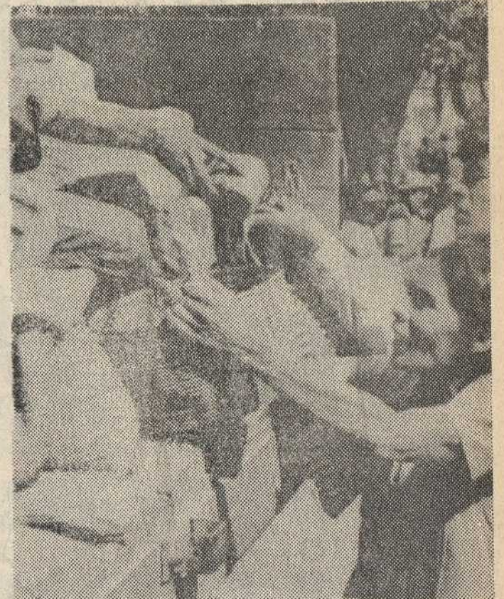
Chimaltenango, Guatemala. — Supervivientes del terremoto forman cola ante los camiones que suministran alimentos, procedentes de las ayudas que comienzan a llegar a las zonas afectadas por el desastre. Alubias, arroz y otros comestibles procedentes de diversos países servirán para paliar el hambre que amenazaba ya a diversas áreas del interior guatemalteco