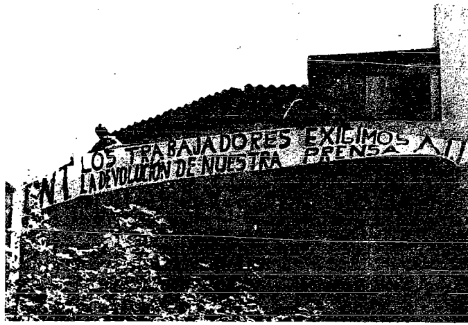
Los militantes anarco-sindicalistas se tomaron el pasado domingo la justicia por su mano, adelantándose a lo que será el final irreversible de una situación histórica ya pasada.