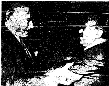
En la sede del PCE, con Santiago Carrillo.