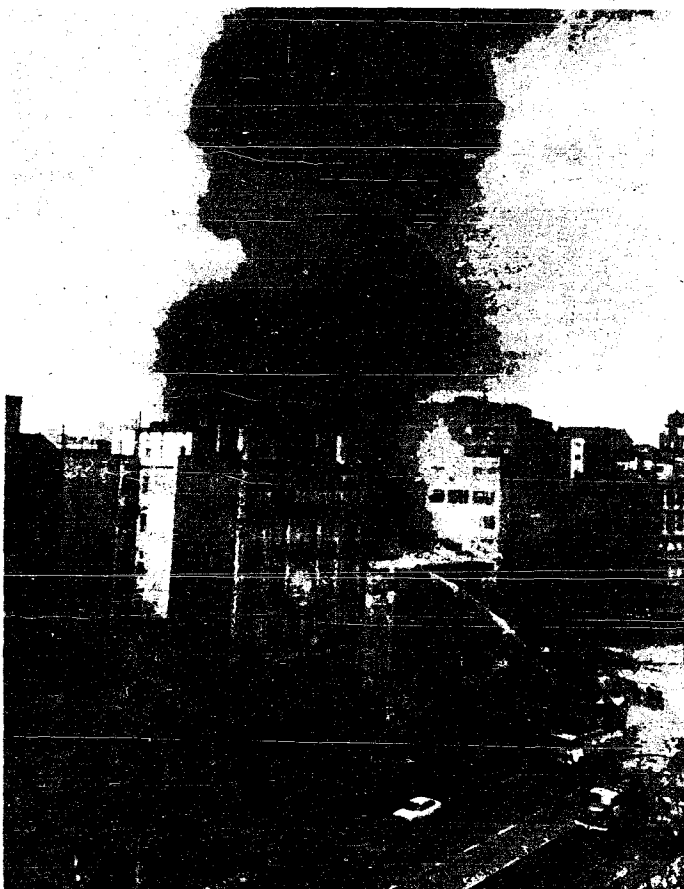
Una densa columna de humo se alza en la mañana del domingo por encima de la ciudad. El restaurante-espectáculo «Scala» ardía por los cuatro costados a consecuencia de un atentado con botellas de líquido inflamable. Cuatro personas morirán a consecuencia del atentado.