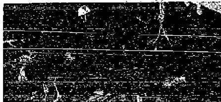
«Dos personas, empleadas del restaurante-espectáculo, permanecen esparcidas entre los escombros del edificio siniestrado. Como en anteriores ocasiones, para buscar los cuerpos de las víctimas se emplea el uso de perros especialmente adiestrados para este menester.»