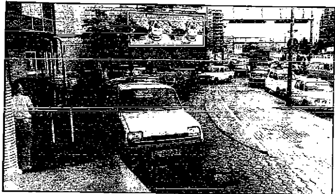
Los previsores llenaron ayer sus depósitos.

El B.O.E. publica hoy el decreto sobre enseñanza del catalán