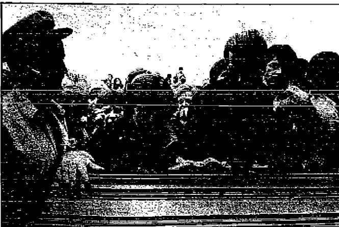
Escenas del profundo dolor en Sabadell.

Marín, es conductor del mencionado Cuerpo. (Segue en pág. 2.)