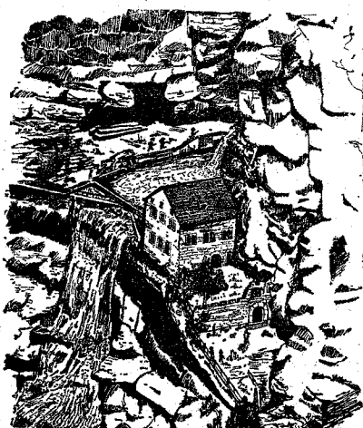
Sant Miquel del Fay Mil Años de Historia

Conozca una maravilla de Cataluña (a 7 Kms. de S. Feliu de Codinas)