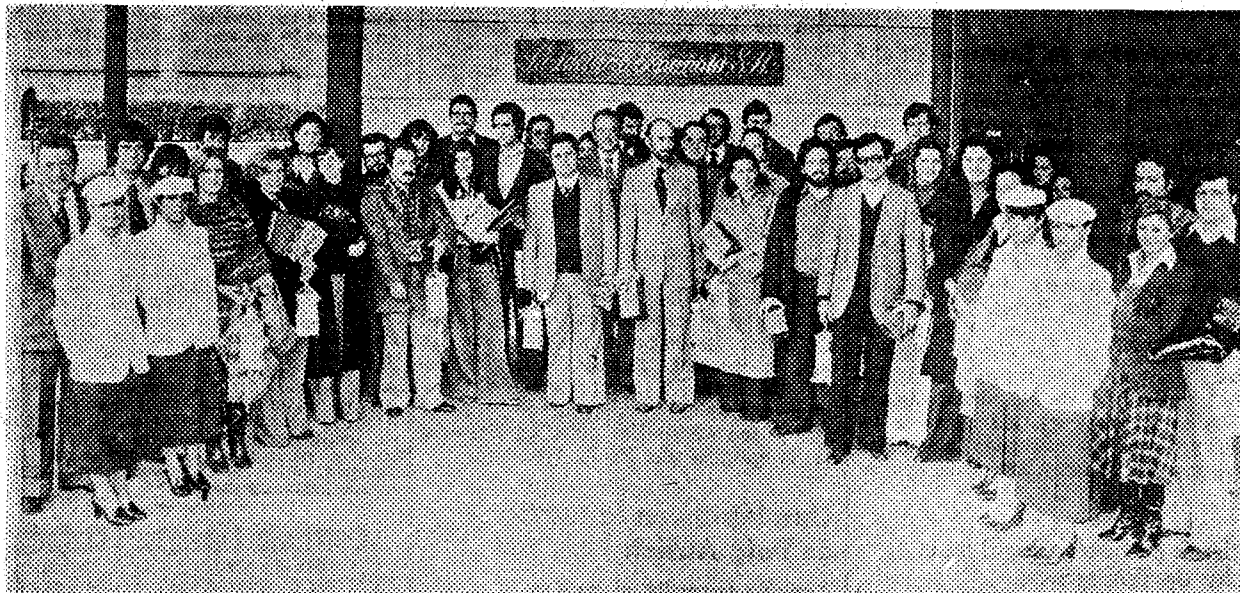
Un grupo integrado por titulados: Médicos, Veterinarios y Farmacéuticos, pertenecientes a la promoción de este año, están visitando en plan de estudios, diversas industrias alimenticias. Con este motivo, celebraron un interesante coloquio técnico con los directivos y técnicos de esta empresa. — R.