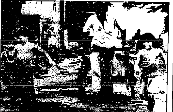
Un padre huye con sus hijos por una calle de Managua, escapando de los intentos bombardeos.