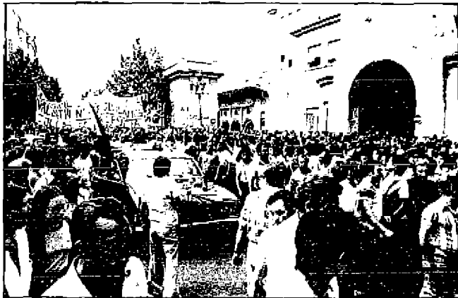
Gritos de rabia y emoción acompañaron el cadáver del joven cenetista muerto por la policía.

En un momento del recorrido, al llegar a la altura de la Alameda, la cabeza de la marcha pretendió dirigirse hacia el Gobierno Civil en lugar de seguir el itinerario marcado, pero el propio ser-