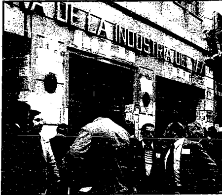
Cooperativa de la Industria del Taxi