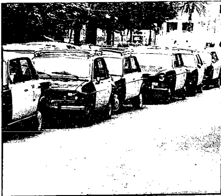
Los trabajadores del Taxi no tienen cubiertas las cuotas de la Seguridad Social.