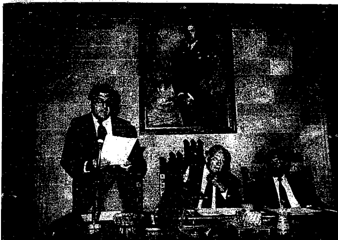
El Consell de Treball se ha creado a iniciativa de Codina.

Sindicatos, empresarios y Generalitat, en la presentación del nuevo organismo