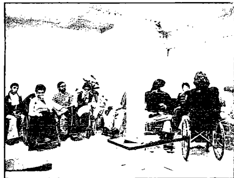
Ya se encerraron antes para que no hubiera expediente.

«Después de la absorción —siguen explicando— ha habido empresas que se querían hacer cargo del trabajo del centro, como fue el caso de Iglesia, y proyectos de contra-