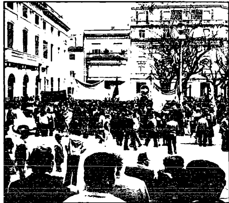
El cinco de abril del pasado año tuvo lugar el primer «europaro».

Además de los objetivos netamente nacionales y estatales de la convocatoria, es importante destacar algunos elementos del análisis que la CES ha tenido en cuenta para decidirse a la movilización de