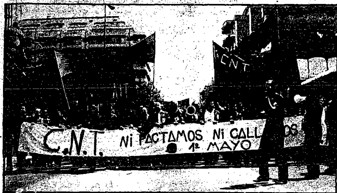
Negociaciones en Madrid sobre el convenio-marco