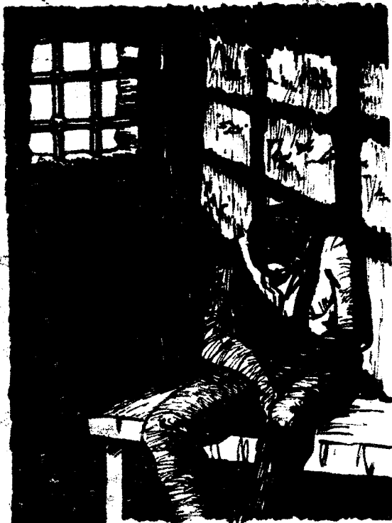
LIBERTAD DETENIDOS CASO SCALA