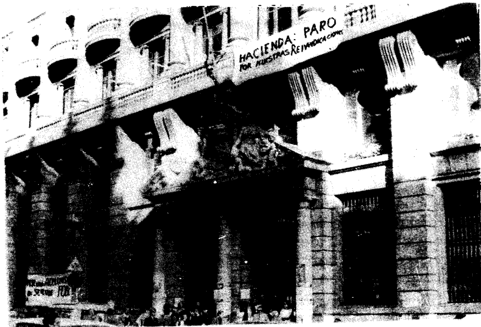
Piquetes de información repartiendo hojas el día de la huelga. Delegación de Hacienda.

Así, en un principio intentamos lograr una coordinación a nivel provincial. el día 13 de diciembre tuvo lugar una Asamblea General de Funcionarios de la Admón. Central de Barcelona en la que se aprobó la plataforma reivindicativa y se acordó provisionalmente realizar un día de paro, el 19 de diciembre, aprovechando que este mismo día se proyectaba un paro en Madrid, en la Admón. Central y en el Ayuntamiento. Igualmente se vió la necesidad de la coordinación con el resto de provincias del Estado.