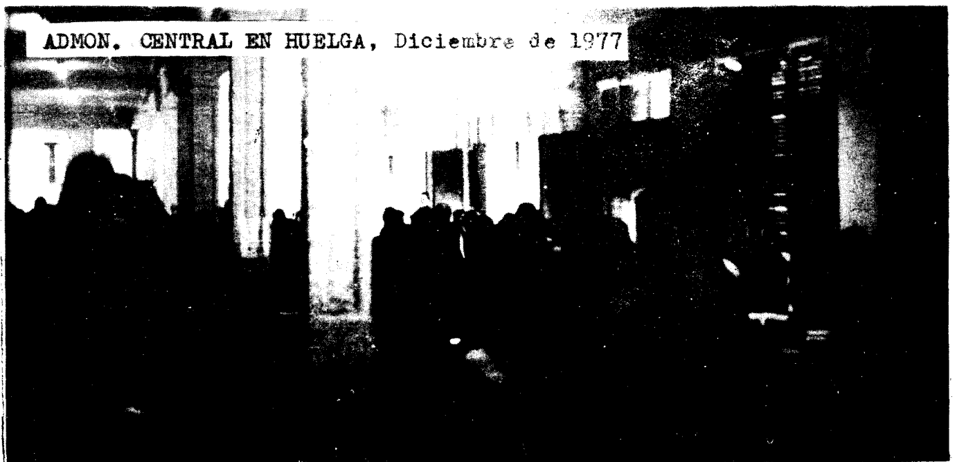
ADMON. CENTRAL EN HUELGA, Diciembre de 1977