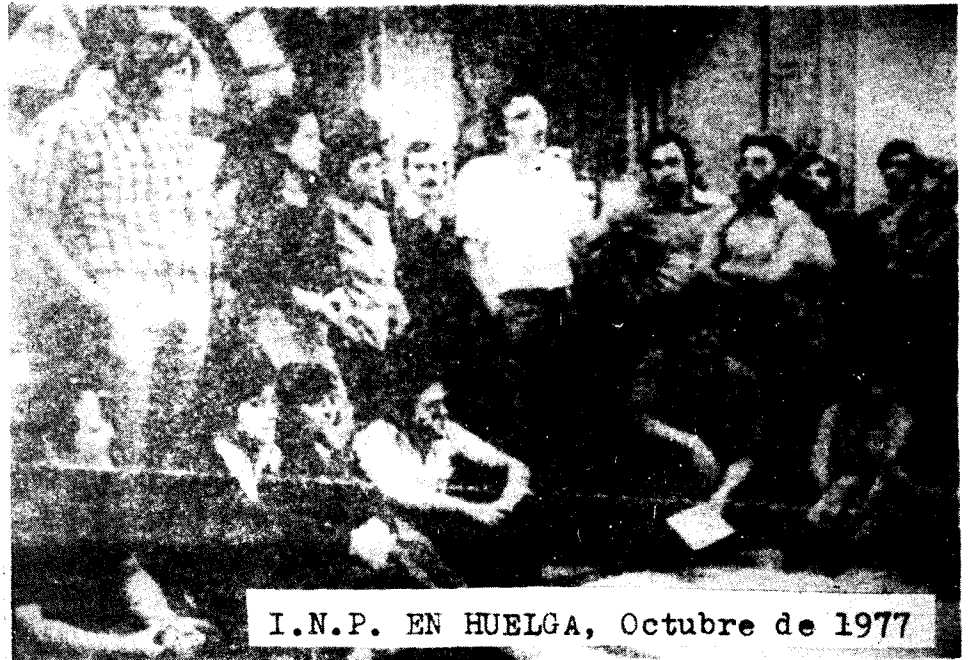
I.N.P. EN HUELGA, Octubre de 1977

PUBLICA ADMINISTRACION DE LA TRABAJADORES