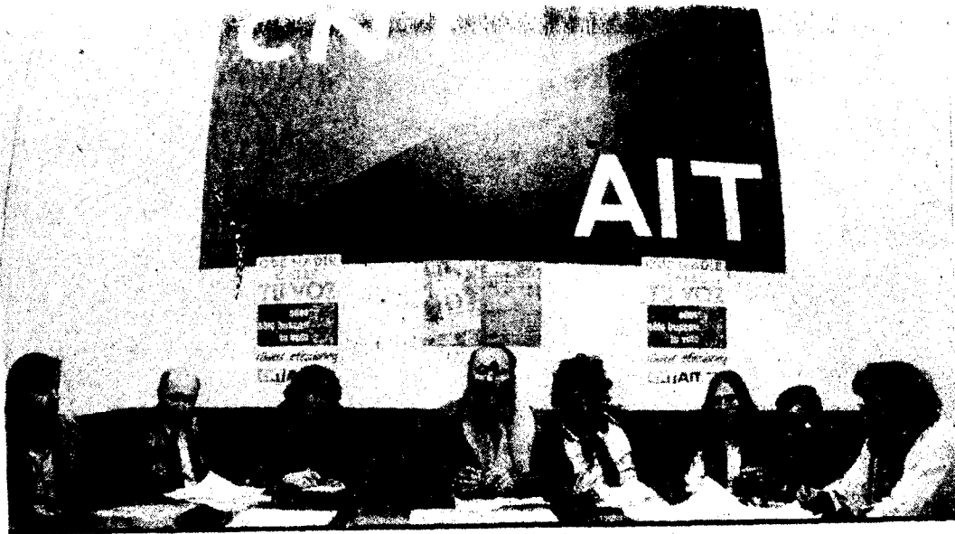
CNT niega estar en posesión de armas