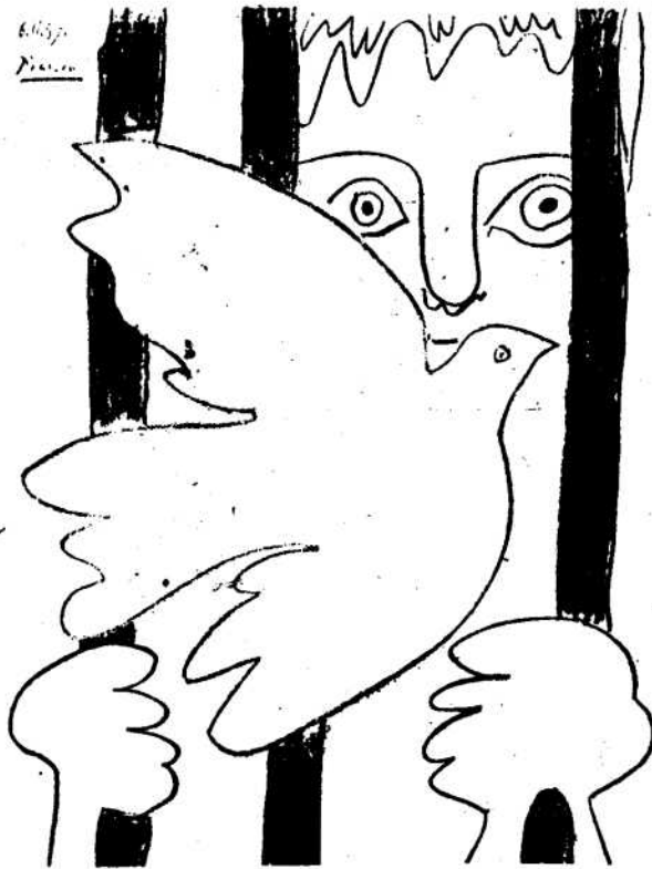
Los políticos han tenido el apoyo de organizaciones y campañas, más o menos clandestinas con el franquismo, a la que responde esta litografía de Picasso en 1959. Los sociales sin solidaridad ni coherencia interna, difícilmente podrían contar con una ayuda externa semejante. LOS "COMUNES" METIDOS EN LA TRAMPA JURÍDICA DEL FASCISMO Y FRUTO DE UNA ESTRUCTURA SOCIAL BASADA EN EL LUCRO, EGOÍSMO, INCULTURA POPULAR, VIOLENCIA Y LA LEY DEL MÁS FUERTE (TODOS CONTRA TODOS)