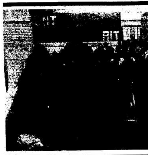
ASAMBLEA ORDINARIA DEL 13 DE ENERO

Hay que empezar a distinguir entre CNT organización y CNT movimiento. Para poder averiguar de una vez quien está dispuesto a construir CNT como sindicato revolucionario y quien está dispuesto a disolver la Confederación en el mismo movimiento, dejando al movimiento obrero sin su mejor arma, la CNT.