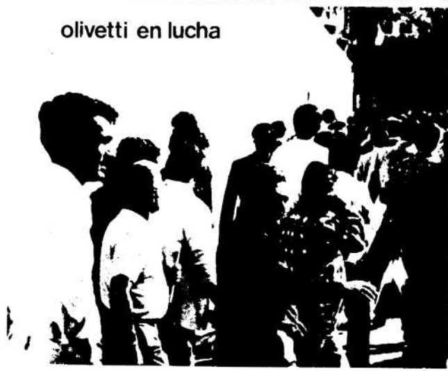
olivetti en lucha