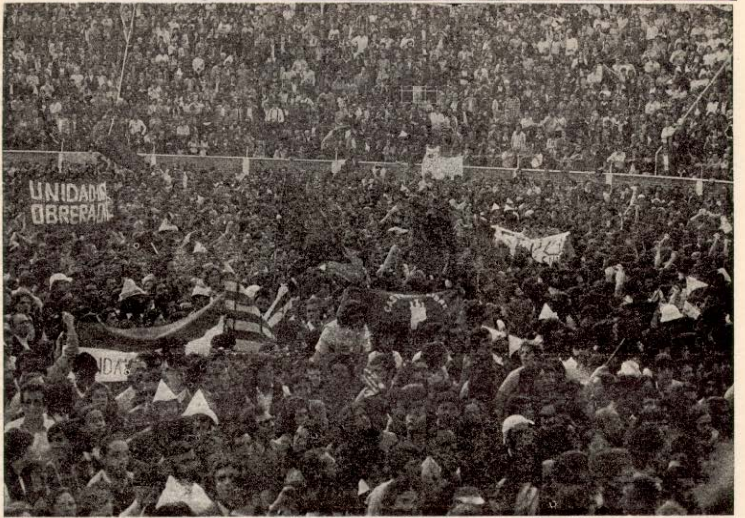
El mitin celebrado el pasado 27 de marzo, en Madrid, abarrotando la plaza de toros de San Sebastián de los Reyes. Fue una demostración irrefutable de resurgir de la CNT y el espíritu libertario.

III EPOCA 5 PTAS BARCELONA ESPECIAL 1.º de MAYO 4 PAGS. NUMERO 12