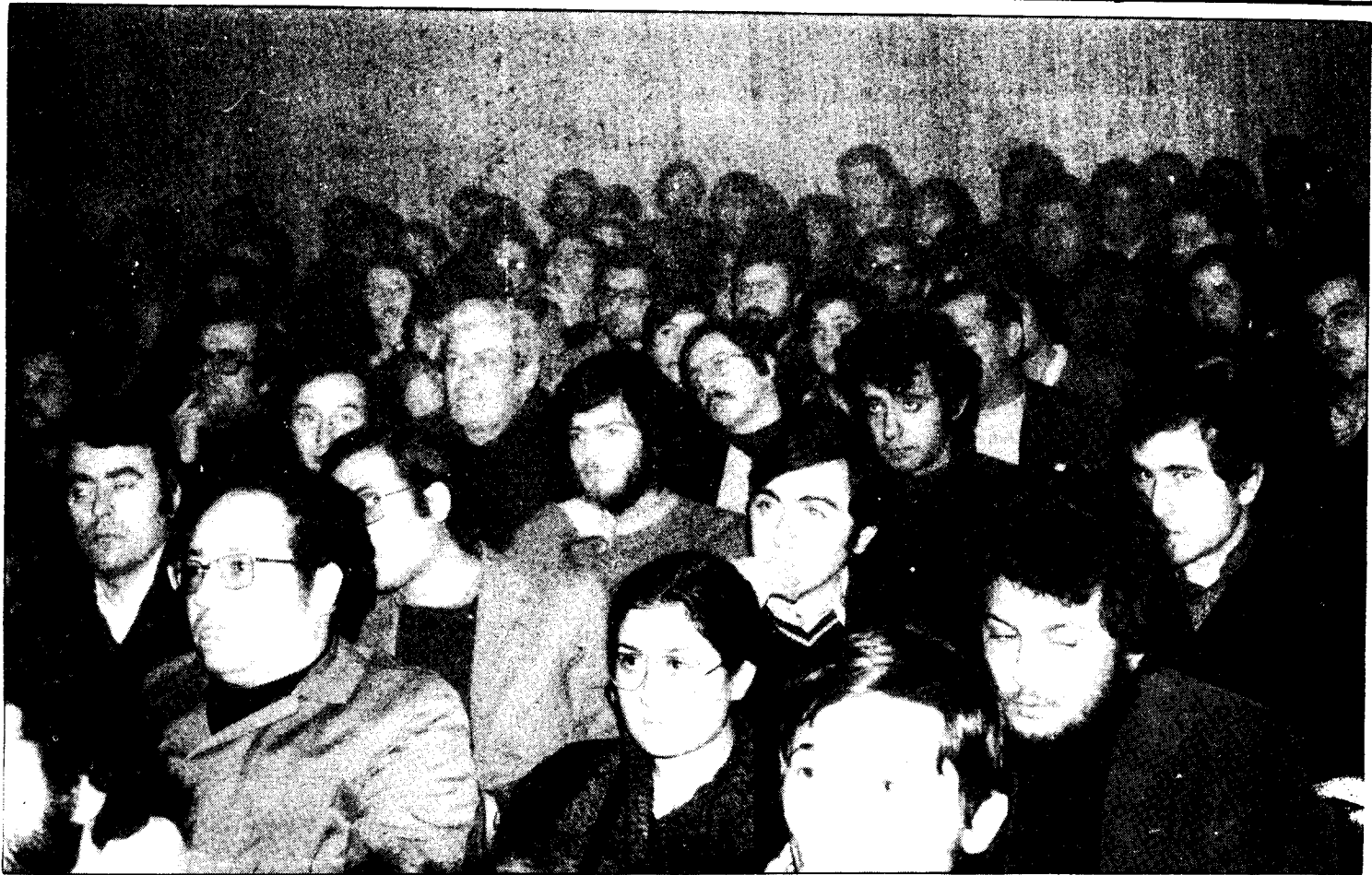
Molta gent a l'assemblea. La veu dels treballadors de gràfiques es comença a sentir.