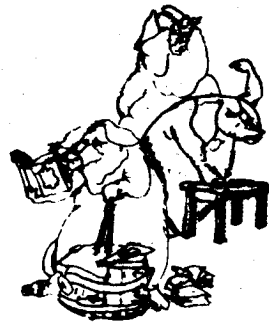
Gobierno y Sindicatos aplicando la revisión del convenio de Hostelería 78.

A) En primer lugar esos delegados no representan a nadie, porque en la mayoría de los establecimientos de hostelería no hubo elecciones.