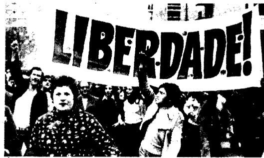
PRIMERO DE MAYO EN LISBOA

Este año, este 1º DE MAYO en España se dá en una situación muy especial :