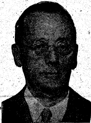
El Dr. José Giral Presidente del Gobierno Provisional de la República Española

promiso en esta materia. En el caso de que una solución de este género se produjera en España, sería examinada con la más estricta objetividad por el Gobierno Republicano, que fijaría públicamente su posición a este sujeto, después de haber consultado a los Partidos y Organizaciones del interior y las que están en el exilio.