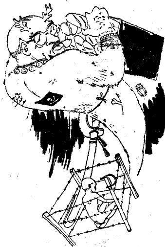
He aquí cual es la vida del pueblo español semetido al monstruo franquista