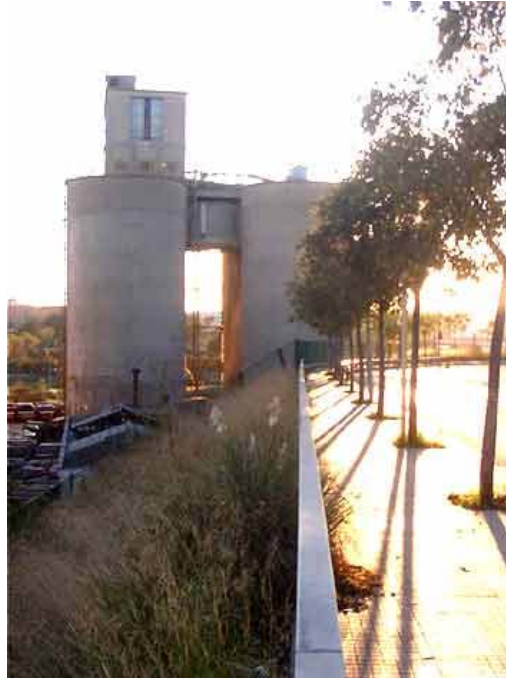
Sitges de ciment a la fàbrica de plaques" (Any 19??)