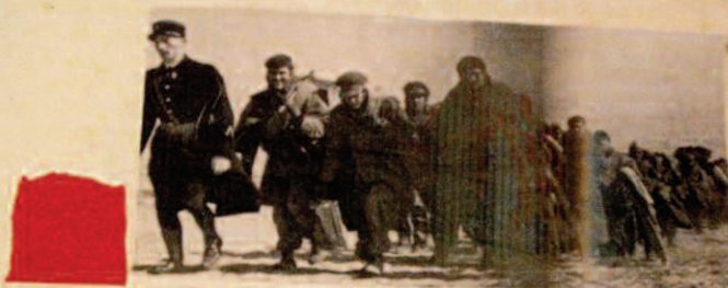
Cravure Marie de la Rosa 2005