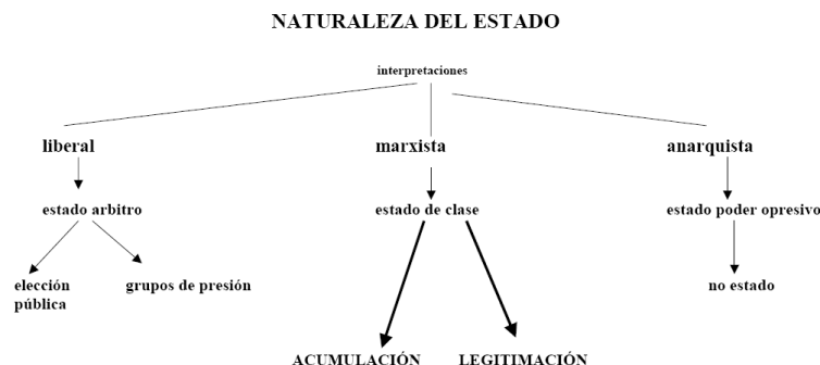
(b) Distintas interpretaciones sobre la naturaleza del Estado

do significa crear otras relaciones, otras formas de interacción' (G. Landauer).