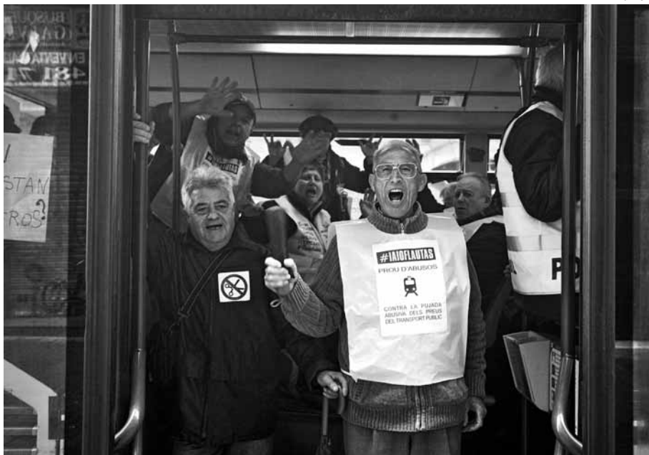
Un grup de iaioflautes ocupa un autobús de la línia 47 per protestar per la pujada del preu i les retallades als transports públics

esta ciutat, rere llargs anys de lluita. Drets socials que no van ploure mai del cel sinó que es van haver de defensar a peu de carrer.