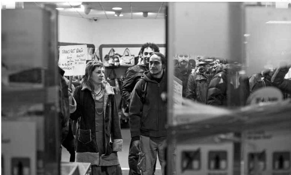
Un grup d'usuàries va protagonitzar l'1 de febrer una colada massiva a la Plaça Catalunya contra la pujada de preus

En el manifest també es denuncia la gegantina dimensió macrocefàlica dels organismes de gestió del transport metropolità (EMT-AMB, EMT, ATM), amb un pressupost