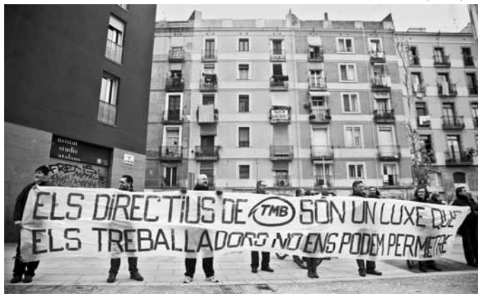
Pancarta que s'ha mostrat durant el boicot a la inauguració de la nova Filmoteca de Catalunya

ropa, tenint en compte la relació amb el salari mínim interprofessional" i apunten que en els darrers deu anys el preu del bitllet ha augmentat quatre vegades més que els salaris. En la darrera dècada, la T-10 ha passat de costar 5,6 euros a 9,25.