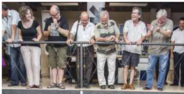
Inauguració de la seu del grup cooperatiu Ecos el 26 de juny de 2012 a Barcelona.