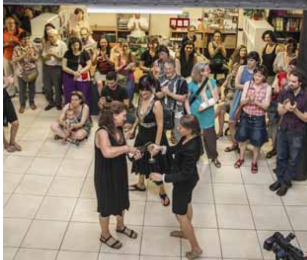
A sota, trobada estatal de la cooperativa de serveis financers ètics i solidaris Coop57, l'octubre de 2011 a les Cotxeres de Sants de Barcelona. Coop57