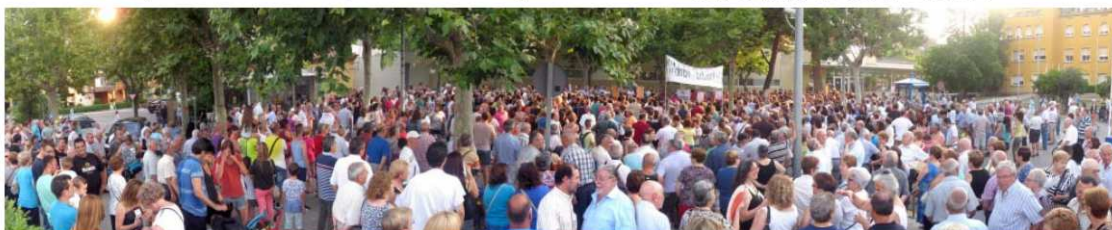
Imatge de la gran concentració que va tenir lloc el 19 de juliol al davant de l'hospital, per demanar que no perdi especialitats

Per acabar, quin missatge voleu traslladar als lectors de L'Eramprunyà? La CGT veu el problema des d'un punt de vista social, més que laboral. El que busquem és lògic i just, ja que és una gran incongruència desmantellar un hospital com el nostre, amb molt bona reputació i resultats. Viladecans és el paradigma que la bona gestió pública millora de llarg els resultats quantitativs i qualitatius de la gestió privada, bolcada a obtenir uns beneficis econòmics que, sovint, desplacen la qualitat assistencial a un segon pla. Molts dels treballadors i els nostres familiars també som usuaris de l'hospital. Per això ens interessa el mateix: un hospital amb condicions laborals correctes, econòmicament sa, ben gestionat, amb una excel·lent qualitat assistencial i capaç de fer front, com a mínim, al 90% de la demanda sanitària d'atenció especialitzada. No pretenem que a l'hospital es faci cirurgia cardíaca d'alt nivell, però tampoc renunciem a poder ingressar, durant el temps que calgui, qualsevol afectat per una insuficiència cardíaca. Per això reivindicuem els 18 llits d'UCI previstos al projecte d'ampliació, i seguirem lluitant per impedir que decisions polítiques contràries als interessos de la ciutadania trenquin la històrica dinàmica de resolutivitat, eficiència i qualitat de l'hospital de Viladecans.