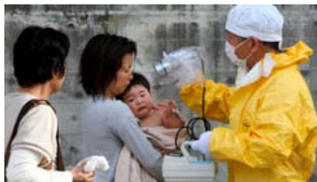
1. L'escala INES (International Nuclear Event Scale) es va instaurar per l'Organisme Internacional de l'Energia Atòmica (OIEA) per tractar d'objectivar la comunicació de la gravetat dels incidents nuclears va de 0 (incidència) fins a 7 (accident molt greu amb sortida massiva i dispersió a llarga distància del material radioactiu). L'existència de l'escala INES, donat el seu caràcter caritatiu, no ha aconseguit objectivar els debats sobre la gravetat dels esdeveniments nuclears i menys encara sobre el risc nuclear.

El mateix es pot dir dels líders de CiU, PSOE i PP, que van pactar poc abans de l'accident la retirada de la limitació de la vida de les nuclears a 40 anys de l'esborrany de la Llei d'Economia Sostenible. La posició del Consell de Seguretat Nuclear (CSN) va deixar molt a desitjar quant a la falta d'informació sobre el que estava passant i la seva tova actitud davant la sol·licitud de més proves d'estrès a les plantes nuclears espanyoles. El grup de pressió nuclear espanyol té el dèficit de tarifa elèctrica com a element de pressió en enfront de qualsevol govern. Segons la comptabilitat del mercat elèctric els devem uns 30.000 milions d'euros a les elèctriques per aquest concepte.