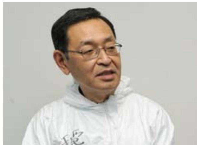
Masao Yoshida, 17 Febrer 1955 — 9 Juliol 2013

Els treballadors han de ser rellevats després d'assolir la màxima dosi radioactiva permesa. Es calcula que passen per Fukushima uns 11000 treballadors a l'any. En un país com el Japó amb un índex d'atur molt baix (abans del tsunami era del 4%) és difícil aconseguir treballadors que es juguin la salut en el control de la radioactivitat. S'han presentat denúncies sobre la contractació de sense sostre i també sobre el fet que ha sigut la yakuza japonesa qui s'ha encarregat de fer les contractacions. Així doncs, aquells primers herois han sigut reemplaçats per indigents, treballadors sense recursos, jubilats en dificultats, persones endeutades o joves sense formació. Les diferents tasques se subcontracten, amb la qual cosa és quasi impossible mantenir un control sobre les condicions dels treballadors. De fet, una investigació de l'agència Reuters va localitzar fins a 733 empreses exercint com subcontractadores a la zona. Es tracta d'aconseguir beneficiar-se de l'accident i d'aconseguir part dels 75000 milions d'euros que seran invertits a recuperar la zona en els anys vinents. Hi ha hagut múltiples denúncies d'irregularitats: els treballadors només cobren els dies que treballen, no tenen assegurança mèdica, se'ls obliga a pagar el seu propi menjar i fins i tot a pagar la seva pròpia màscara. Tal acumulació de denúncies hi hauria de, com a mínim, provocar una investigació per part del govern.